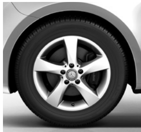
43,2 cm (17") Leichtmetallräder, vanadiumsilber lackiert, mit Bereifung 225/55 R 17 (RL8)