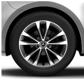
45,7 cm (18") Leichtmetallräder, glanzgedreht, mit Bereifung 245/45 R 18 (R10)