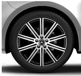
48,3 cm (19") Leichtmetallräder, schwarz lackiert, glanzgedreht, mit Bereifung 245/45 R 19 (R1Q)