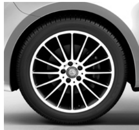
48,3 cm (19") Leichtmetallräder, schwarz lackiert, Front glanzgedreht, mit Bereifung 245/45 R 19 (RK3)