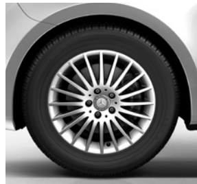
43,2 cm (17") Leichtmetallräder, vanadiumsilber lackiert, mit Bereifung 225/55 R 17 (RK8)