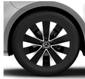
43,2 cm (17") Leichtmetallräder, Aerorad, glanzgedreht, mit Bereifung 225/55 R 17 od. 235/55 R 17 (R1N)