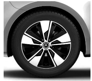
45,7 cm (18") Leichtmetallräder, schwarz lackiert, Stirnseite glanzgedreht, mit Bereifung 245/45 R 18 (R1P)