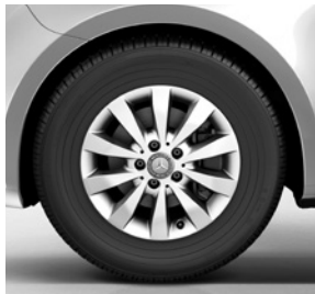
40,6 cm (16") Leichtmetallräder, vanadiumsilber lackiert, mit Bereifung 205/65 R 16 (RL5)