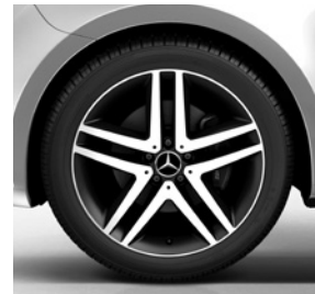
48,3 cm (19") Leichtmetallräder, schwarz lackiert, Front glanzgedreht, mit Bereifung 245/45 R 19 (RL3), nur i. V. m. Line SPORT, siehe ab S. 31