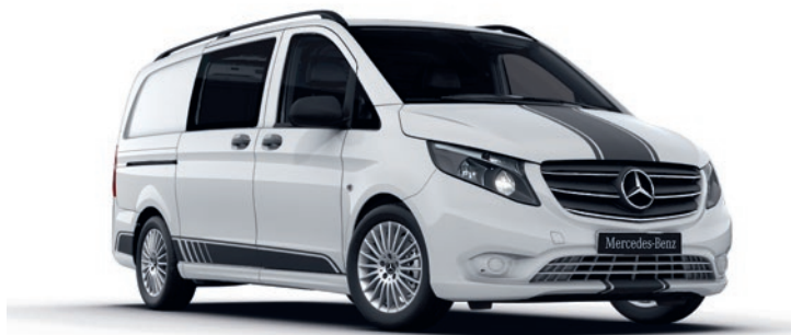
Der Vito Kastenwagen als Line SPORT.

Kombiinstrument mit Pixel-Matrix-Display